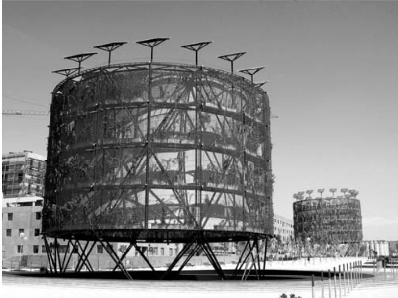
Ilustr. 6: Boulevard Bioclimático (Madrid)