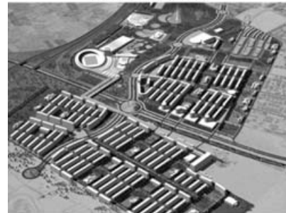
Ilustr. 5 Ecociudad de Valdespartera (Zaragoza) (maqueta del proyecto)