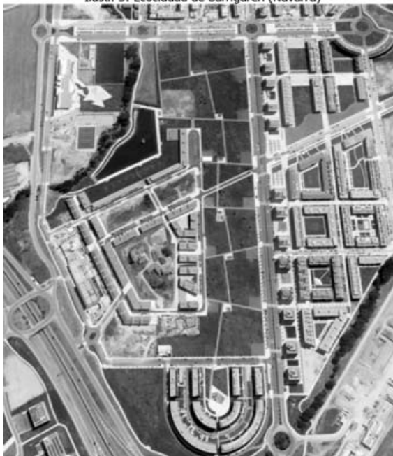
Ilustr. 5: Ecociudad de Sarriguren (Navarra)