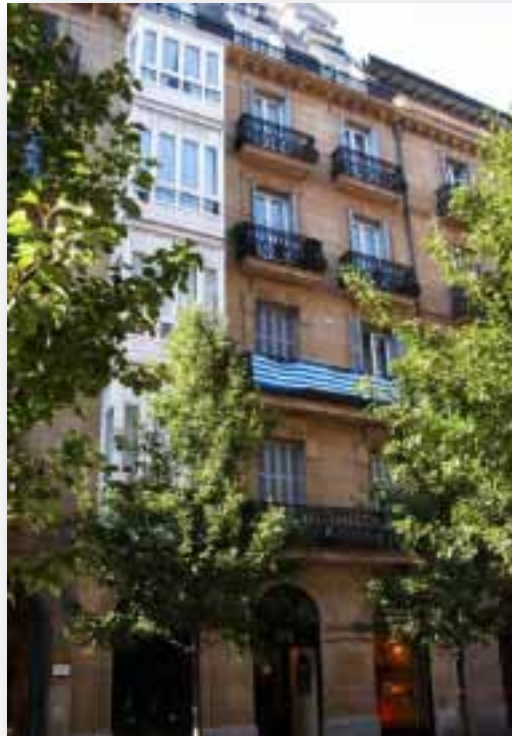
C/ Getaria, 18