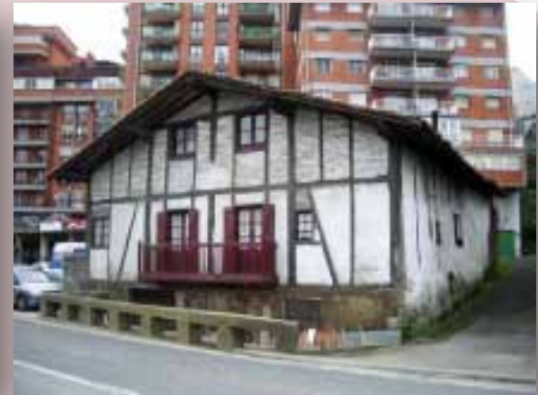
Patxillardeggi (protegido y en peligro de traslado)