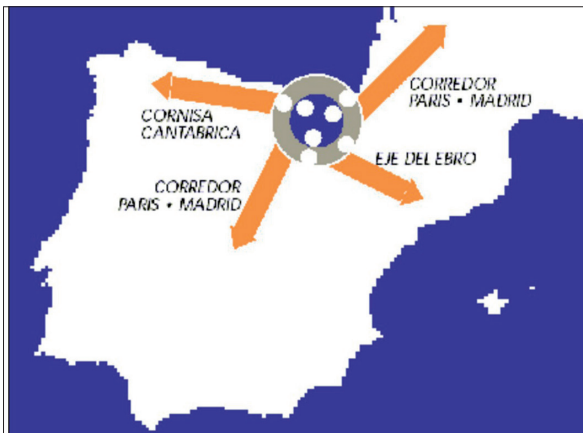
Ilustración 2: Rotula Vasca

Además, la Comunidad Autónoma del País Vasco (CAPV), está situada en una región ubicada en el centro geográfico del Arco Atlántico, lo que le proporciona una importante situación estratégica para su propio desarrollo, así como para promocionar acciones generadoras de asociaciones para todo el espacio Atlántico (18). Euskal Herria se localiza así en el nudo o bisagra de diferentes ejes y conforma la denominada Rótula Vasca, ofreciendo un pasadizo natural del eje Paris-Madrid, desde el cual se puede dirigir hacia la Cornisa Cantábrica, y/o hacia el eje del Ebro (ver ilustración 2).