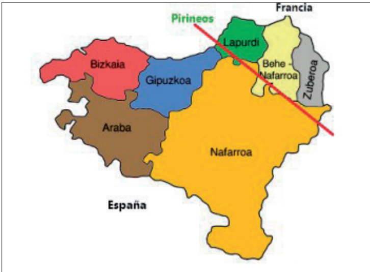
Ilustración 1: Divisiones territoriales de Euskal Herria

Y si bien, el término “Euskal Herria”, hoy en día no define un espacio político institucional como tal, sí define una entidad histórica y cultural que comparte una parte significativa de patrimonio, arte, cultura, idioma, historia e identidad. Euskal Herria, así visto, es el país de los vascos y vascas visto desde un punto de vista histórico, cultural, lingüístico y de identidad (15).